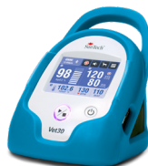
Azul "pavo real"