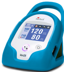
Azul "pavo real"