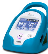
Azul "pavo real"