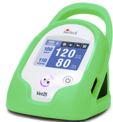
Verde "rana arborícola"